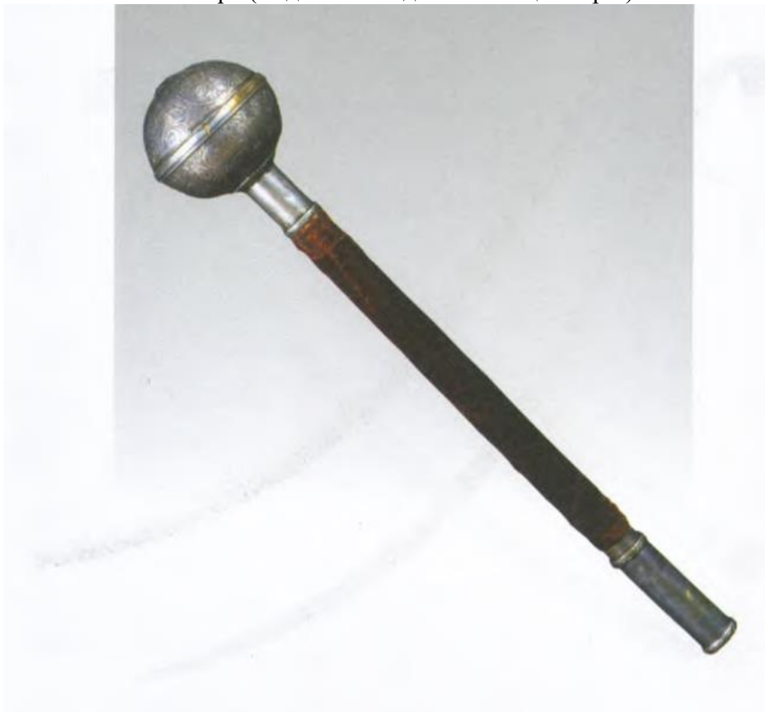
Козацька булава XVIII ст. 6

Відзнака гетьмана – булава – відома у Запорозькому Війську з кінця XVI сторіччя. Як своєрідну нагороду-відзнаку її надавали польські королі або московські царі. Богдан Хмельницький, наприклад, мав булави від польського короля Яна Казимира та російського царя Олексія Михайловича. Спочатку козацькі полковники мали за власну відзнаку булави, а пізніше перначі, або шестопери. Зовні перначі нагадували булави, їх так само прикрашали коштовним камінням, різьбленням, але замість кулі на кінці вони мали шість металевих пластин – пера (звідси й походить назва цієї зброї).