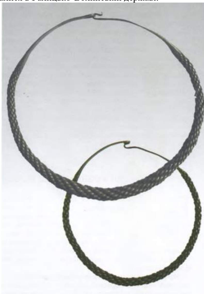
Шийні гривни Київської Русі XI – XII ст. 3

Шийні нагородні гривни мали вигляд переплетених між собою металевих смужок або ланцюжків, розплющених на кінці. На плаский кінець гривни часто наносилися рослинні орнаменти або зображення тварин, як реальних, так і міфічних. У такому вигляді шийні гривни як нагороди проіснували аж до монгольської навали та занепаду Київської Русі, а також використовувалися в Галицько-Волинській державі.