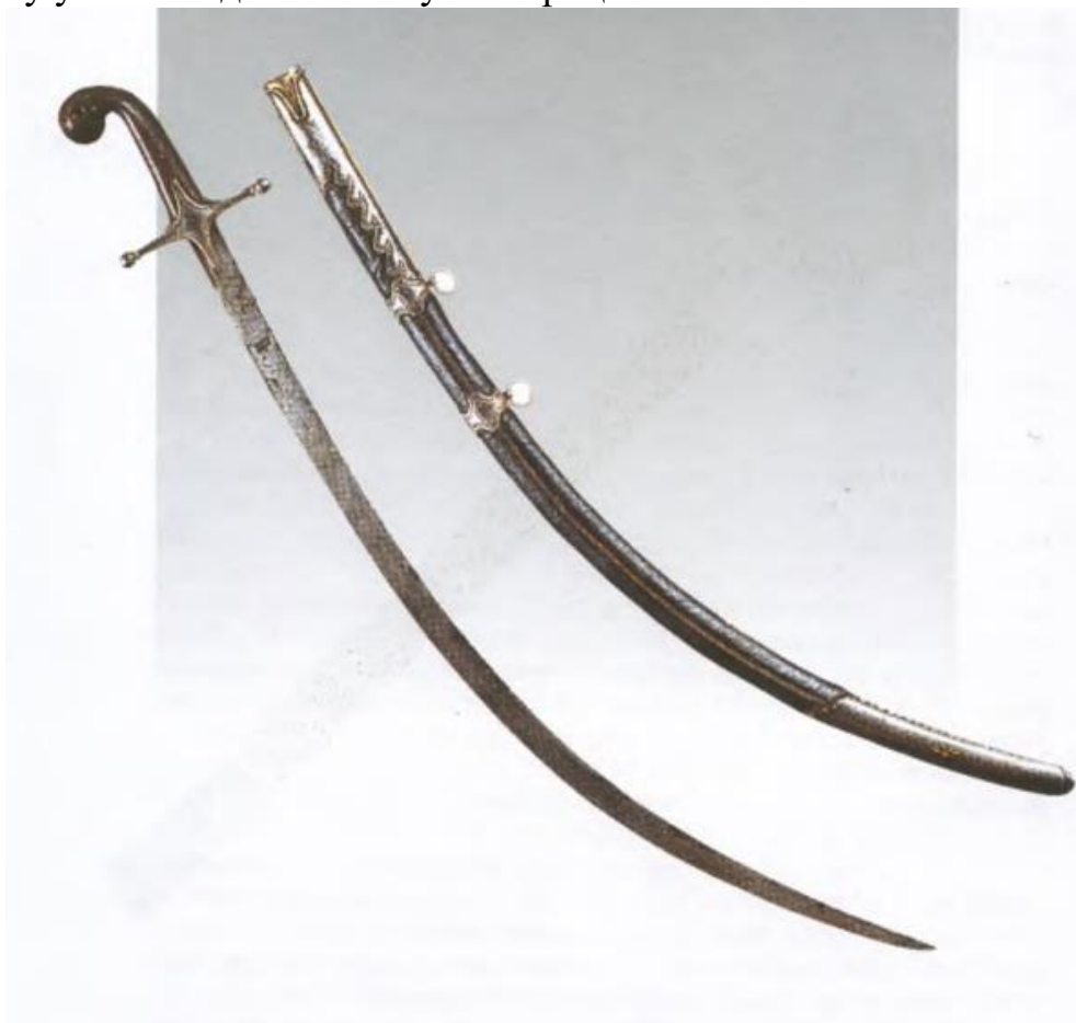
Нагородна козацька зброя XVII – XVIII ст. 4

Українське козацтво, яке значну частину часу проводило у військових походах, створило власну систему нагород і відзнак для тих осіб, які проявили себе у битвах. Будучи людьми військовими, для яких зброя є найбільшою цінністю, козаки в основу нагород поставили зброю. Козаків, які найбільше відзначилися в боях, нагороджували переважно шаблями, які часто були трофеєм, знятим зі знатного супротивника. Крім того, козацькі гетьмани та козацька старшина нерідко отримували нагородні шаблі від польських королів або російських царів, а також іноземних послів. Так, відомим є факт нагородження польським королевичем Володиславом IV гетьмана Петра Конашевича Сагайдачного мечем з королівської зброярні за мужність, проявлену у битві під Хотиним у 1621 році.