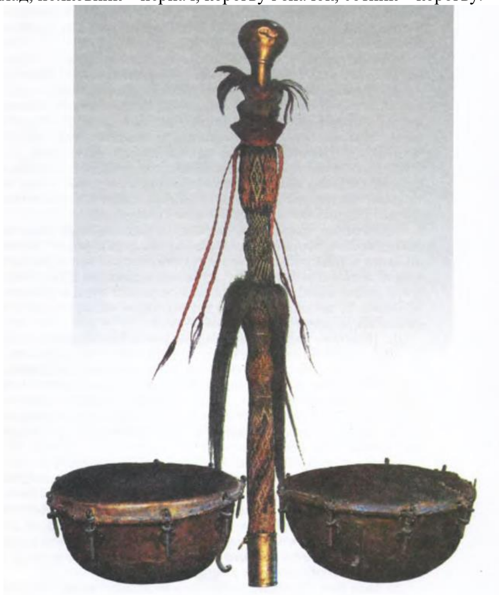
Бунчук. Литаври козацькі XVII ст. 5

Козацька держава – Гетьманщина – мала власну оригінальну систему військових відзнак. Називалися вони клейнодами, або клейнотами, і з'явилися в козацькому війську наприкінці XVI століття, поширившись у роки Української революції під проводом Богдана Хмельницького. Як відомо, 1655 року для урочистого виїзду гетьман мав червону корогву з образом архангела Михаїла, бунчук з білого кінського хвоста і біле знамено з гаптуванням герба Богдана Хмельницького. За часів Речі Посполитої клейноди як атрибут влади та гідності надавали козацькому війську польські королі, а пізніше – російські царі. Клейноди виконували роль загальновійськових відзнак або відзнак посадових осіб. До перших належали гетьманська булава, бунчук, печатка, корогви, литаври, бубни, палиця з комишу, або комишина, іноді також козацька «гармата», тобто артилерія. Власні відзнаки мала й нижча старшина, наприклад, полковник – пернач, корогву і значок, сотник – корогву.