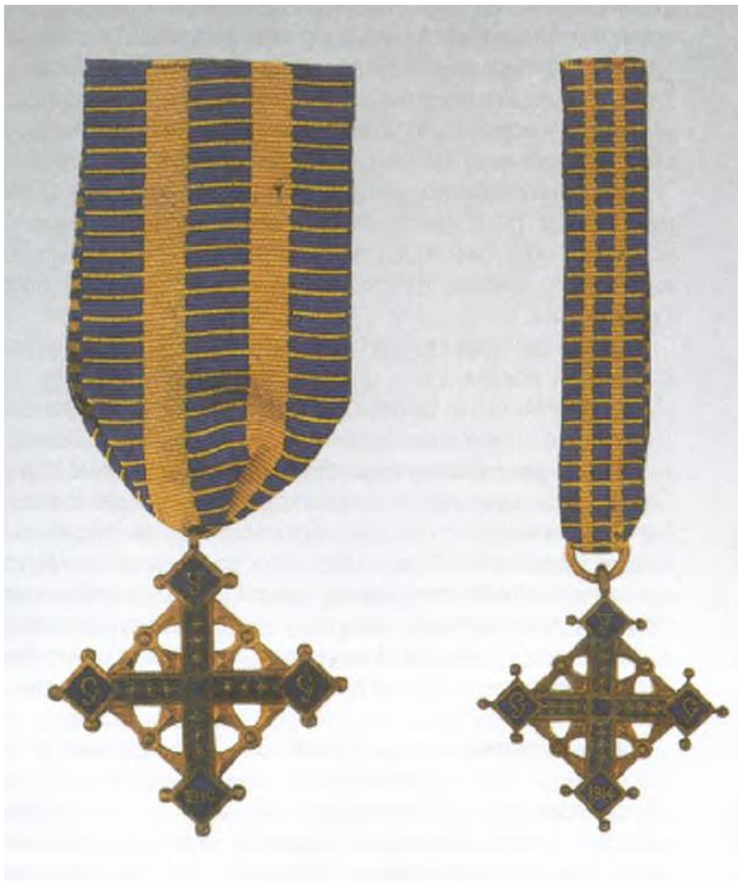
Хрест Легіону Українських Січових Стрільців. 1918 р. 8

Австро-Угорської імперії. Цікаво, що метал для виготовлення знака (бронза) постачався за правління Павла Скоропадського з Української Держави. Хрест мав два розміри: більший, «парадний» (45 мм у діаметрі) та менший «на щодень» (діаметром 36 мм). Таким чином, Хрест Легіону УСС став першою відзнакою на нагородній ниві України.