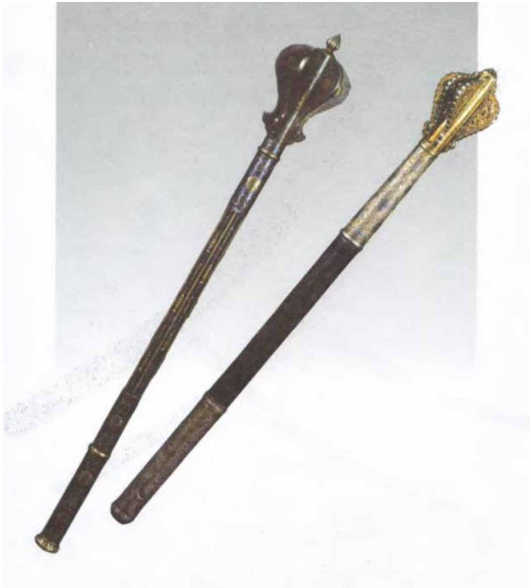
Козацькі перначі XVII – XVIII ст. 7

Разом із тим слід відзначити, що козацькі клейноди не були нагородами в повному значенні цього слова, вони правили за посадові знаки, які надавалися до посади. Власної системи нагородних знаків, наприклад орденів, хрестів, медалей, у козацькому війську запроваджено не було.