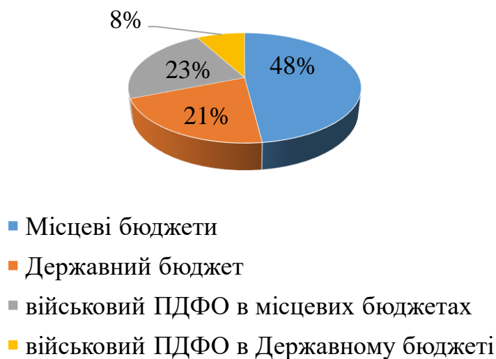
Рис. 2. Співвідношення надходжень від ПДФО з трудових доходів у місцевих та державному бюджетах у 2022 р. до загальних надходжень ПДФО у зведеному бюджеті України

Предметом дискусій є й місце сплати ПДФО, який сплачується (перераховується): податковими агентами – до відповідного бюджету за їх місцезнаходженням (розташуванням) в обсягах податку, нарахованого на доходи, що виплачуються фізичній особі, крім податкових агентів-фізичних осіб (ПДФО зараховується до відповідного бюджету за місцем реєстрації такої фізичної особи у податкових органах) та фізичних осіб, які отримують доходи від особи, яка не є податковим агентом (зараховується до відповідного бюджету за податковою адресою такої фізичної особи). ПДФО з доходів за здавання фізичними особами в оренду (суборенду, емфітевзис) земельних ділянок, земельних часток (паїв), виділених або не виділених у натурі (на місцевості), сплачується податковим агентом або фізичною особою до відповідного бюджету за місцезнаходженням таких об'єктів оренди.