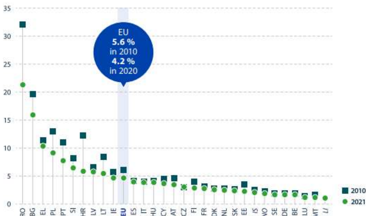
Частка зайнятості населення у сільському господарстві, мисливстві та пов'язаних з ними видах діяльності (% частка від загальної зайнятості) у 2010 і 2021 роках (за даними Євростат) 8

Румунія. Відповідальними за контроль щодо використання підтримки фондів EAGF та EAFRD є декілька румунських інституцій.