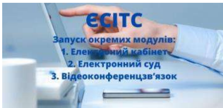
Рис. 2 3

Окрім того, у Рекомендаціях Ради суддів України від 02.03.2022 р. щодо роботи судів в умовах воєнного стану зазначено: «якщо за об'єктивних обставин учасник провадження не може брати участь у судовому засіданні в режимі відеоконференції за допомогою технічних засобів, визначених КПК, як виняток допускати участь такого учасника в режимі відеоконференції за допомогою будь-яких інших технічних засобів, у тому числі власних» 4 . Верховний Суд також підготував лист «Щодо окремих питань здійснення кримінального провадження в умовах воєнного стану» № 1/0/2-22 від 03.03.2022 р., в якому, серед іншого, уможлилювалась участь у режимі відеоконференції за допомогою інших засобів, ніж передбачені КПК України, при цьому наголошувалося на необхідності роз'яснення такому учаснику його процесуальних прав та обов'язків (пункт 7) 5 .