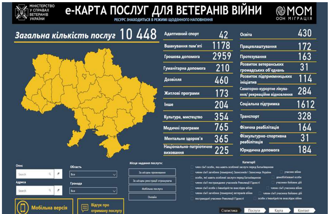
Рисунок 1. е-Карта послуг для ветеранів війни 23 .

Окрім того, на офіційному вебсайті Міністерства у справах ветеранів України наявний доступ до: системи надання безоплатної правничої допомоги (державна