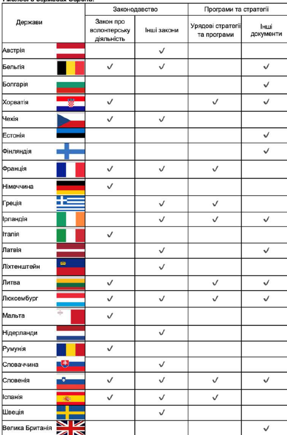
Порівняльна таблиця засад правового регулювання волонтерської діяльності дітей і молоді в державах Європи.