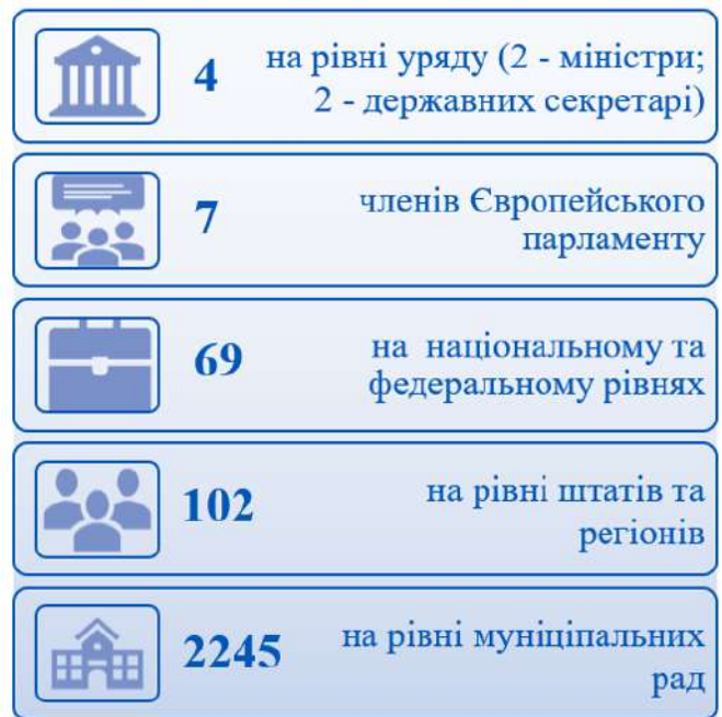
Рисунок 1. Політики турецького походження в Європі.

Із початком повномасштабного вторгнення виток людського капіталу України за кордон зростає. У цьому контексті досвід Туреччини у взаємодії з її