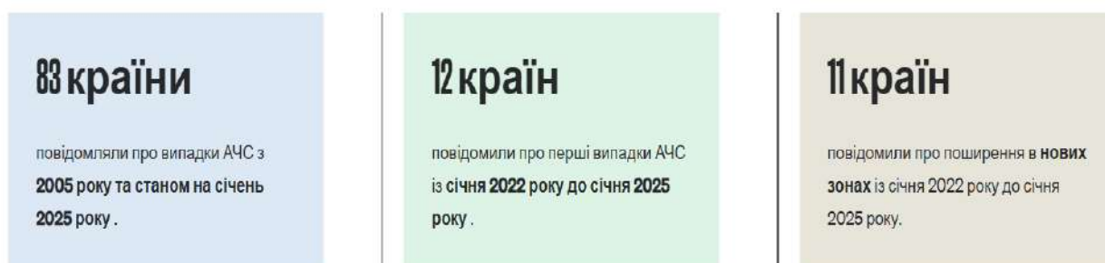
Рис. 2. Динаміка АЧС з 2005 по 2025 року 42

Станом на листопад 2024 року одна держава в Європі та одна територія в Азії повідомили про нові випадки АЧС, тоді як дев'ять держав в Європі оновили інформацію про поточні випадки. Із держав / територій Африки, Америки та Океанії не надійшло жодного повідомлення про нові спалахи. В Азії та Європі було зареєстровано 25 нових спалахів серед домашніх свиней та 197 – серед диких кабанів, що призвело до загибелі 602 тварин серед домашніх свиней. Більшість спалахів, зареєстрованих за цей період, відбулися в районах з високою щільністю свинарства. Кількість спалахів серед домашніх свиней і диких тварин, про які повідомлялося шляхом негайних нотифікацій і подальших звітів, із липня 2024 року знижується в усьому світі, але 10 спалахів були зареєстровані на відстані понад 10 км за межами раніше уражених районів, аж до 75 км в Албанії. Із січня 2022 року 12 країн повідомили про АЧС як про перший випадок захворювання в країні, а 11 країн повідомили про її поширення на нові зони. Із січня 2022 року було зареєстровано понад 741 000 випадків АЧС у свиней і понад 26 400 випадків у диких кабанів. Із січня 2022 року 63 країни і території повідомили про випадки АЧС на їх території 40 . У 2024 році було зареєстровано понад 500 випадків АЧС серед домашніх свиней по всій Європі, особливо постраждали Сербія, Румунія та Україна. У популяції диких кабанів виявлено майже 5 тисяч випадків зараження АЧС. Особливо постраждали Польща, Німеччина та Болгарія 41 .