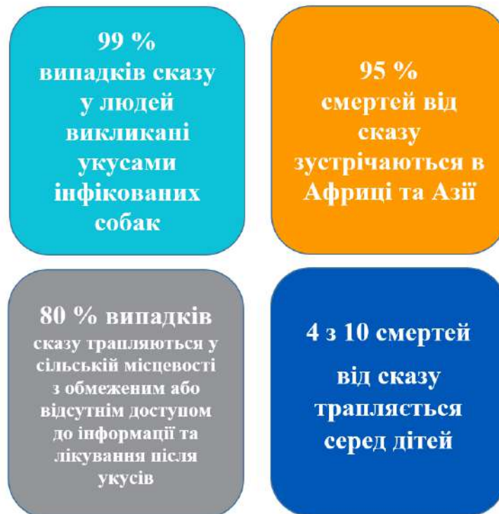
Рис. 1 Статистика за даними Всесвітньої організації охорони здоров'я тварин 27

Більшість смертей від сказу – як у людей, так і у тварин, – спричинені недостатнім доступом до ресурсів системи охорони здоров'я та профілактичного лікування. Це означає, що населення країн із низьким рівнем доходу непропорційно страждає від хвороби.