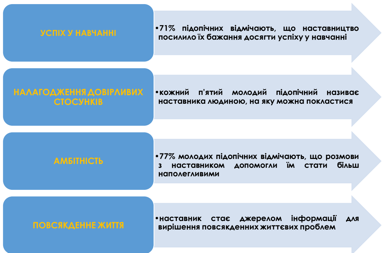
Рис. 2. Досліджувані виміри

Представлено результати за досліджуваними вимірами (Рис 2.) 19 .