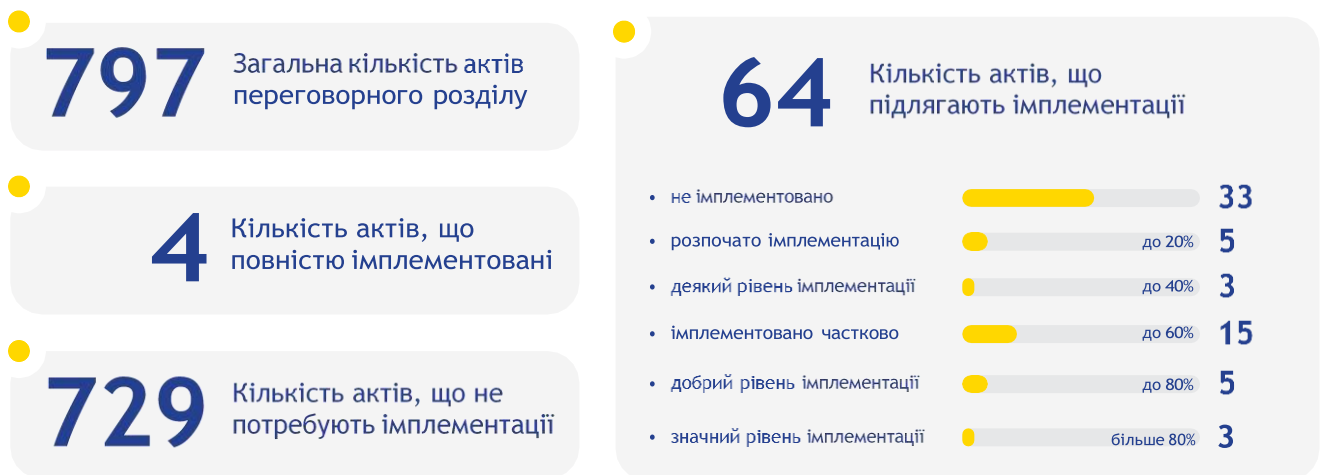
Рис. 1 6 .